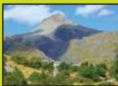
La cime de Pal domine le hammeau des Tourres.

La forêt : composée de 53% de mélèzes, 24% de chênes pubescents et 23% de pins sylvestre.