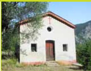
Chapelle Sainte Brigitte

La chapelle des Pénitents (XVII ème /XVIII ème siècles) restaurée en 1830, 1924 et 1982, abrite aujourd'hui le monument aux morts et la salle d'animation culturelle. Dans le village et aux alentours, on peut découvrir huit chapelles dont deux peintes : La Chapelle Saint Jean près du village (où s'élevait autrefois le village de Villars) et la Sainte Pétronille (entièrement rénoverée par la commune).